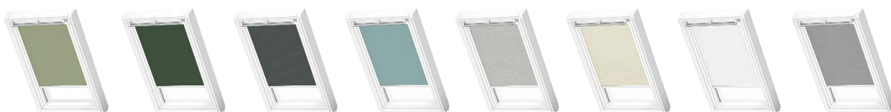
Tenda oscurante a rullo

I colori sono stati selezionati in collaborazione con PEJ Trend, agenzia scandinava che studia e analizza le tendenze in ambito design, moda, interior design. La scelta è caduta su colori tenui, calmi e delicati facili da accostare fra loro e con gli altri oggetti d'arredo della casa, così come avviene anche in natura, dove tutto è armonioso.